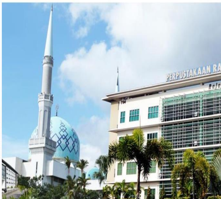
柔佛大学城校区 (1,177 公顷)