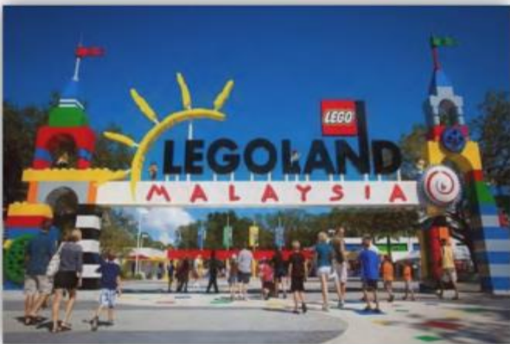
孩童世界·乐高乐园