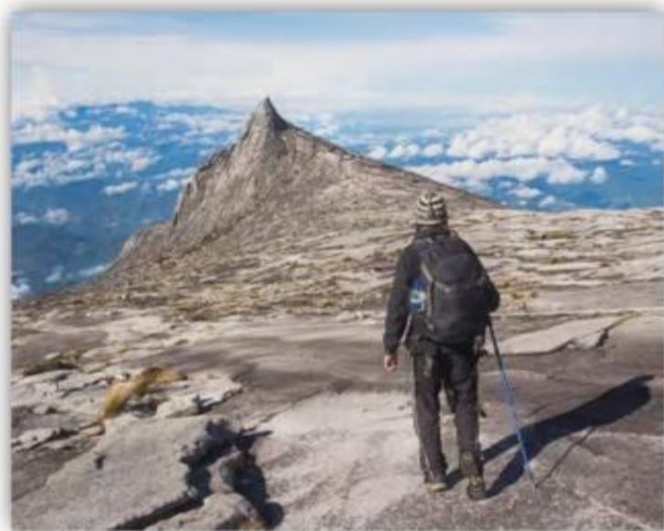
探索神秘·基纳巴卢神山