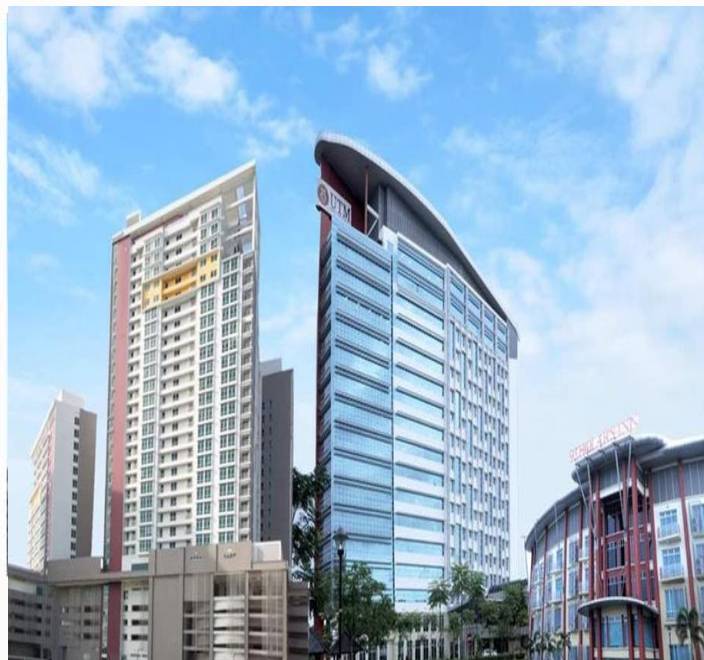
吉隆坡校区 (38 公顷)